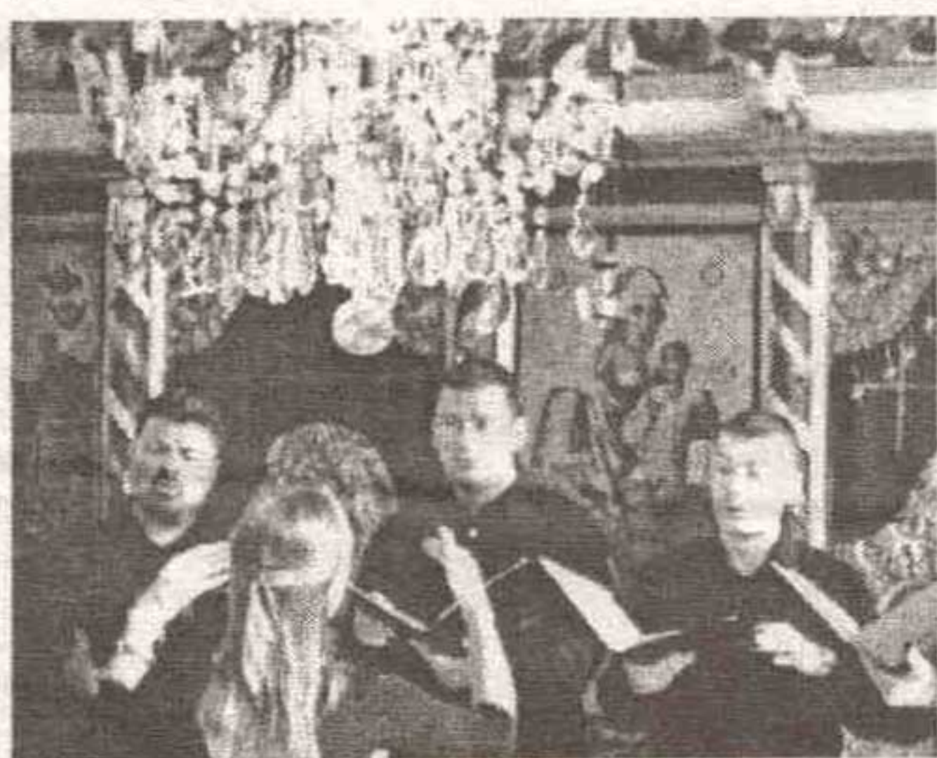
Ansambli „Sv. Arhangel Mihailo“