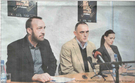
"Umjetnici i klaviri" moto je ovogodišnjeg "A tempa".

Riječ je o koncertu velike hrvatske zvijezde Maksima Mrvice, za čiji su koncert na A tempu karte već rasprodate.