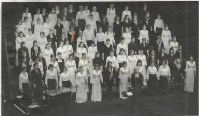
Crnogorski horski ansambl