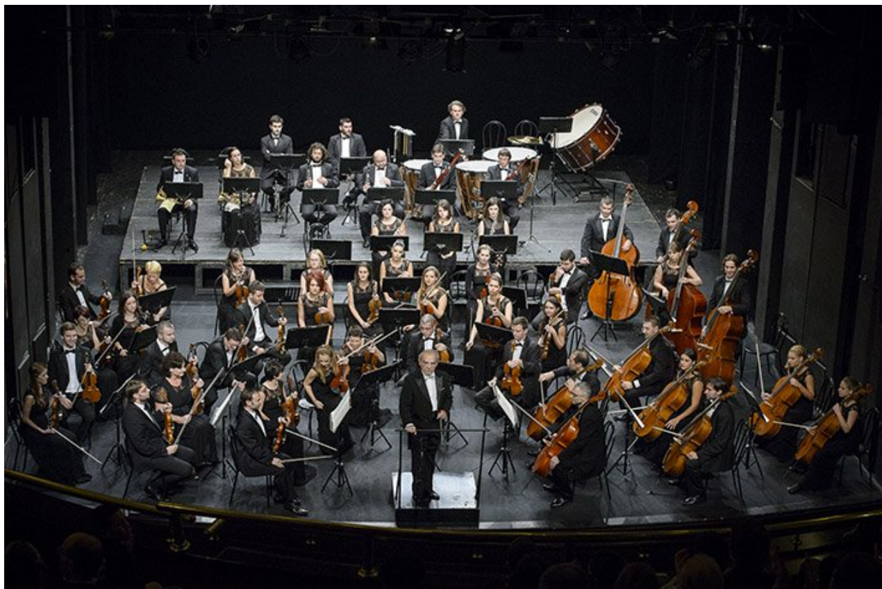
crnogorski simfonijski orkestar