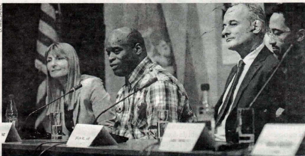
NOVI PROGRAM ZA CRNOGORSKU PUBLIKU: Sa konferencije za novinare u CNP-