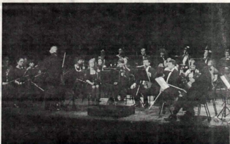
Crnogorski simfonijski orkestar

Događanja na crnogorskoj i svjetskoj kulturnoj sceni