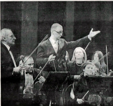
Dirigent Grigorij Krasko (pavi slijeva) sa jednom od koncerata nacionalnog ansambla

nentne ansamble iz cijelog svijeta. Ovo je drugo gostovanje crnogorskih muzičara, budući da su krajem septembra Crnogorski gudači uspješno nastupili u Sankt Petersburgu. Crnogorski simfonijski orkestar ili Karadag Senfoni Orkestrasi, kako je naš ansambl najavljen u programu turskog festivala, prvi je put u svojoj simfonijskoj postavi nastupio sa