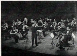
Gudački ansambl Crnogorskog simfonijskog orkestra