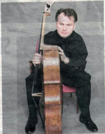
Teden sa instrumentom iz 1711

Koncert se realizuje u saradnji sa Ambasadam Švedske.