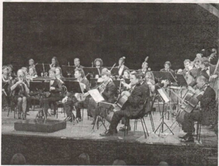
Crnogorski simfonijski orkestar

Događanja na crnogorskoj i svjetskoj kulturnoj sceni