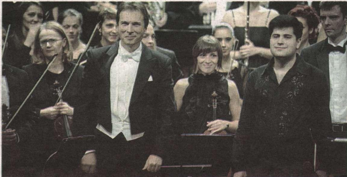
Sigurnost i ljepota: Sa sinoćnjeg koncerta u CNP-u