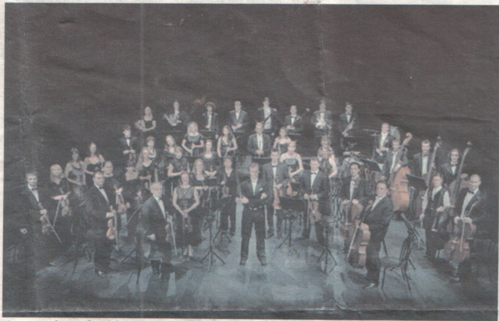
Crnogorski simfonijski orkestar