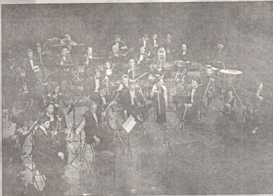
ЦРНОГОРСКИ СИМФОНИЈСКИ ОРКЕСТАР