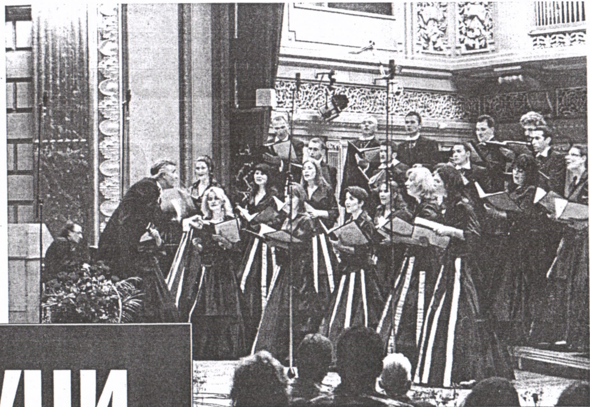
ДУХОВНЕ И СВЈЕТОВНЕ КОМПОЗИЦИЈЕ: ХОР „ЈОАН КРИСТУ ДАНИЕЛЕСКУ”