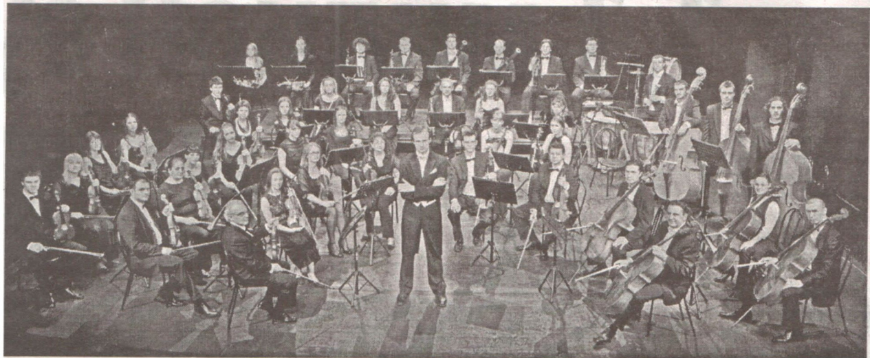
ЦРНОГОРСКИ СИМФОНИЈСКИ ОРКЕСТАР