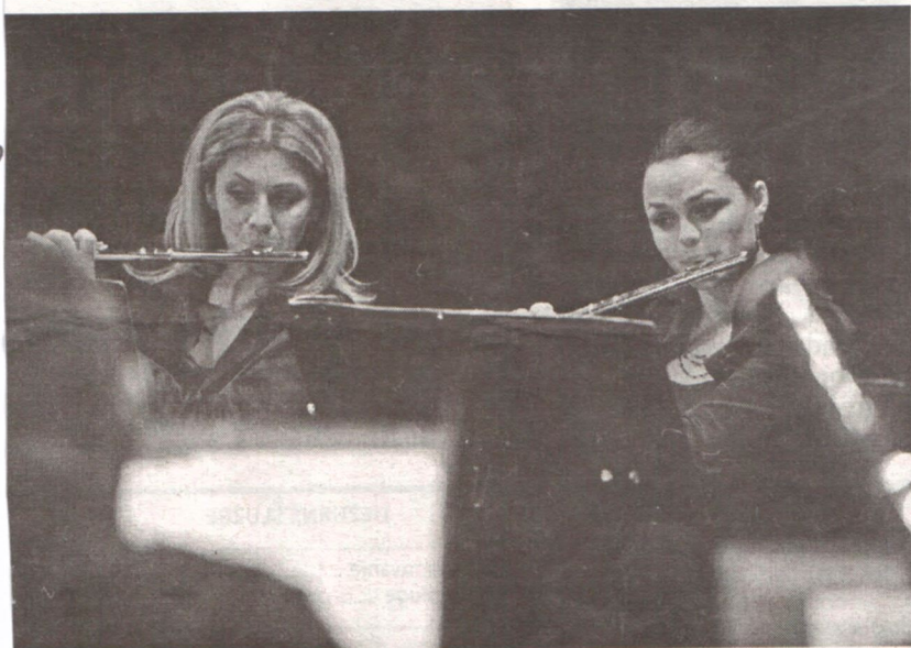
DUVAČKI ANSAMBL CRNOGORSKOG SIMFONIJSKOG ORKESTRA