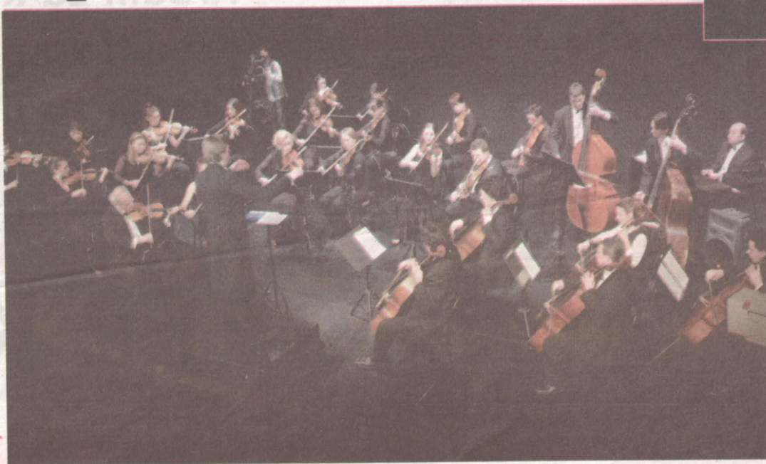
ЦРНОГОРСКИ СИМФОНИЈСКИ ОРКЕСТАР

Слиједи популарни Концерт за кларинет и оркестар у А-дуру, једно од најзначајнијих Моцартових дјела на пољу кон-