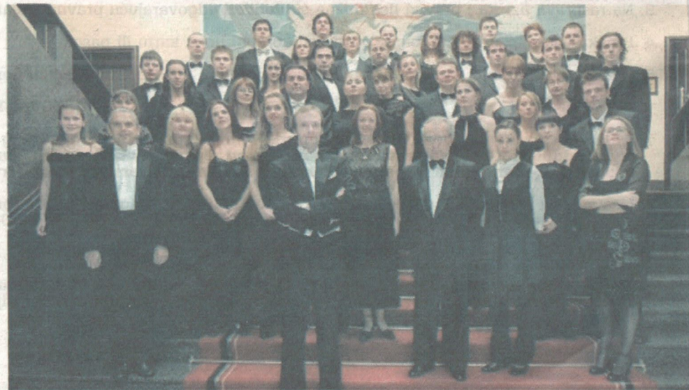
Crnogorski simfonijski orkestar