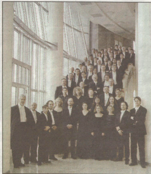
РУСКИ НАЦИОНАЛНИ ОРКЕСТАР