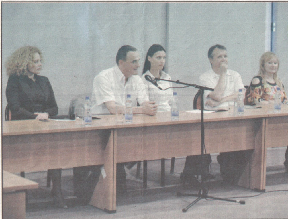
Sa jučerašnjeg presa u CNP-u