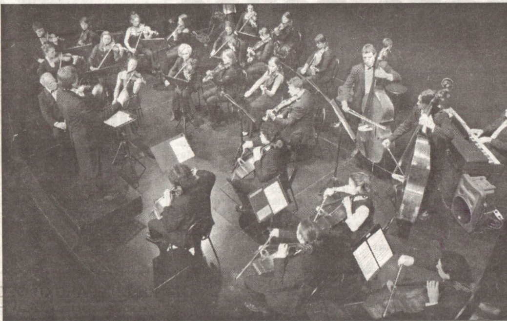
ЦРНОГОРСКИ СИМФОНИЈСКИ ОРКЕСТАР