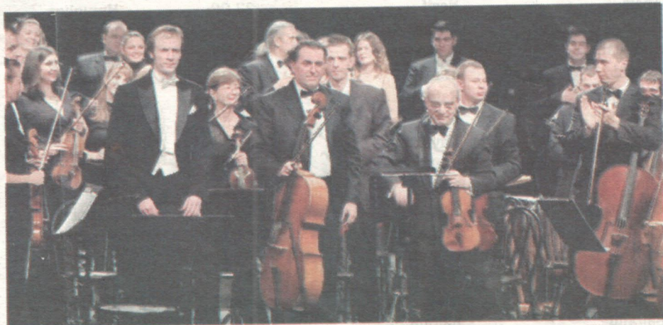
Crnogorski simfonijski orkestar