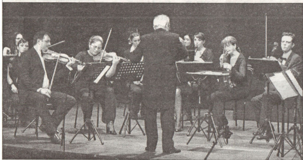
КРЕАТИВНА СНАГА НОВОГ ТАЛАСА: „Црногорски гудачи“

Ансамбл Музичког центра Црне Горе „Црногорски гудачи“ завршиће серију концерата у овој сезони наступом у Бару, вечерас у 21 сат у Дворцу краља Николе. На програму су дјела Хендла, Менделсона, Албинионија, Шуберта и Грига.